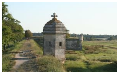
BROUAGE La Place Forte

Ensuite nous visiterons la vieille ville de LA ROCHELLE ainsi que le vieux port.